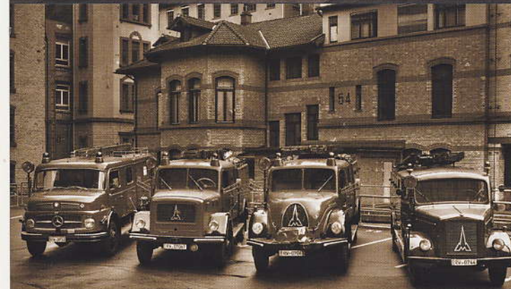
Feuerwehrfahrzeuge aus verschiedenen Epochen