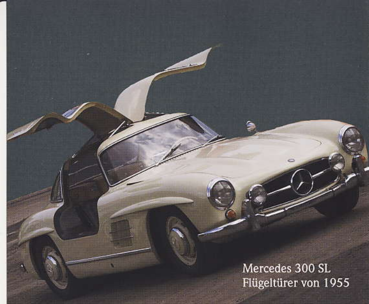
Mercedes 300 SL Flügeltürer von 1955